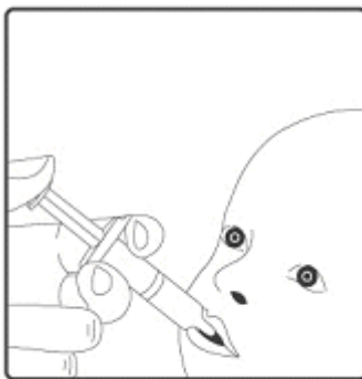
2. Esta vacina destina-se apenas à administração oral . A criança deve estar sentada em posição reclinada. Administrar por via oral (isto é, na boca da criança, na parte interna da bochecha) todo o conteúdo do aplicador oral .