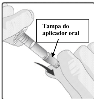
1. Remover a tampa protetora do aplicador oral.

Instruções para administração da vacina com o aplicador oral: