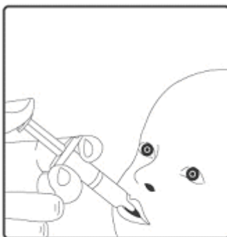
2. Esta vacina destina-se apenas à administração oral . A criança deve estar sentada em posição reclinada. Administrar por via oral (isto é, na boca da criança, na parte interna da bochecha) todo o conteúdo do aplicador oral .