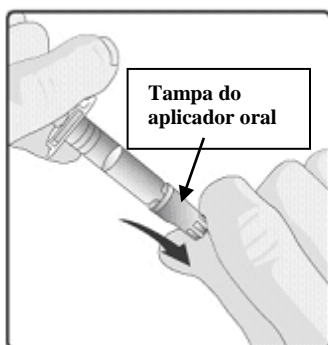
1. Remover a tampa protetora do aplicador oral.

Instruções para administração da vacina com o aplicador oral: